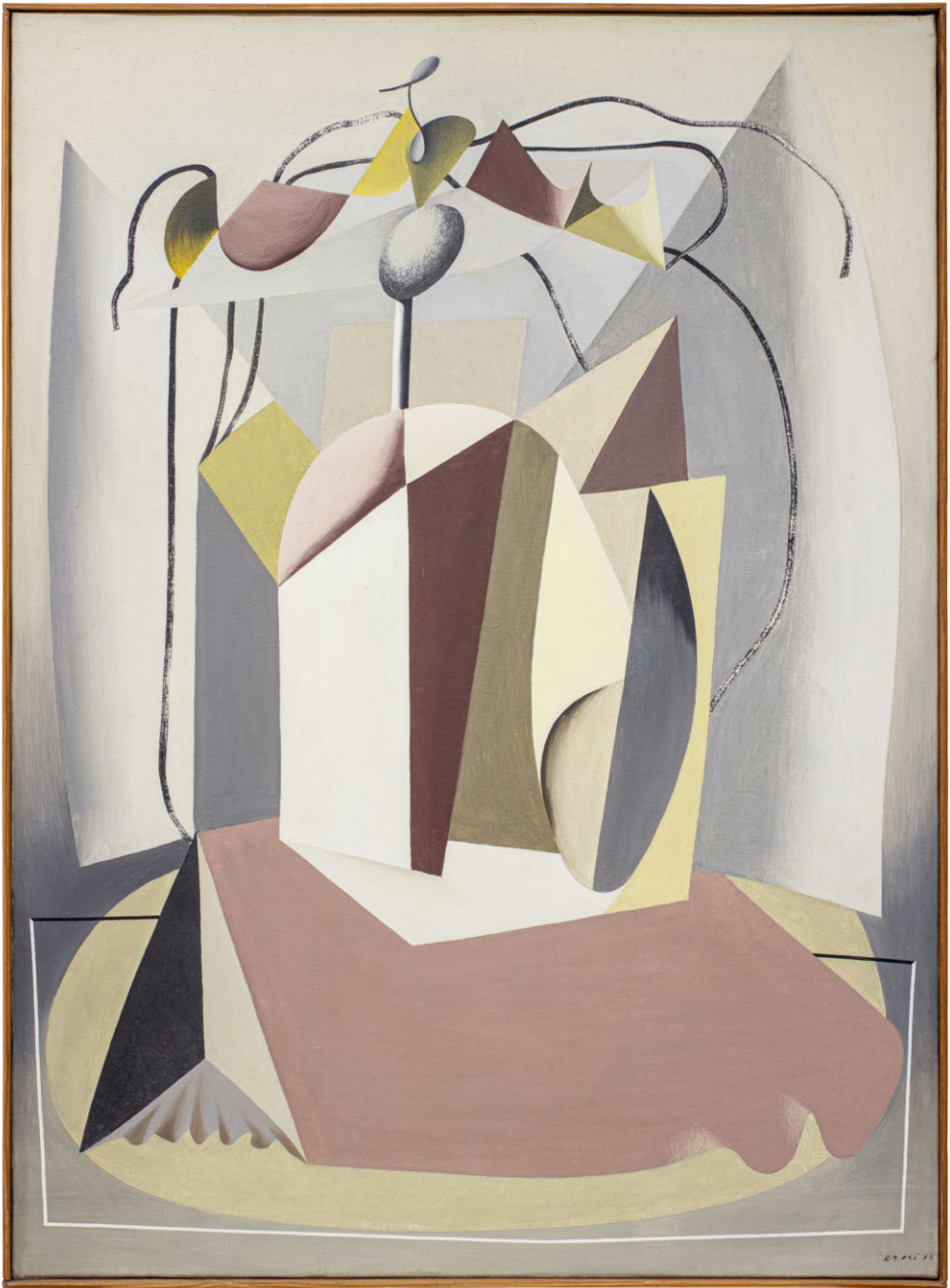
Abbildung 1: Hans Erni, Stravinsky-Carneval (1933), Öl auf Leinwand, 100 × 73 cm (Hans Erni-Stiftung, Depositum der Stadt Luzern, Städt. Kunstsammlung, im Hans Erni Museum; © Hans Erni-Stiftung, Luzern).